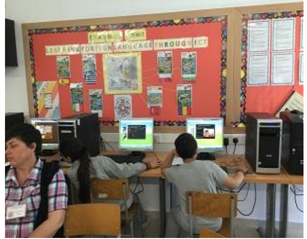
Участници в работната среща